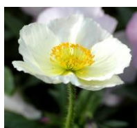
Le pavot blanc