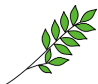
Le rameau d'olivier

C'est un geste de la main réalisé avec deux doigts.