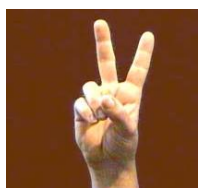
Le signe V