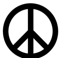
Le symbole « Peace and Love »

C'est un dessin qui représente la paix et l'amour