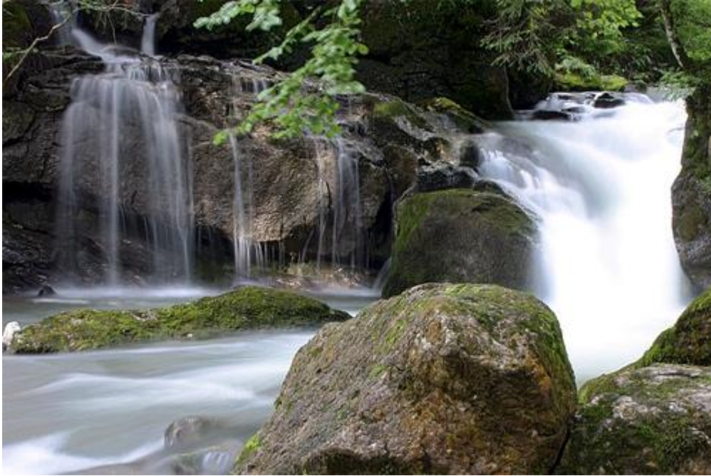
La cascade d'Ardent dans les Alpes, photographie Pascal Lando

Nous venons de le voir, le but est ici de faire une pose suffisamment longue pour obtenir un effet de filet. La lumière étant généralement assez forte, nous risquons donc, avec cette pose longue, de disposer de trop de lumière. Résultat : une photo toute blanche. Réglez donc le nombre ISO au minimum (100 voire 50), et choisissez une vitesse raisonnable : de 1 à 10 secondes (selon les conditions de lumière).