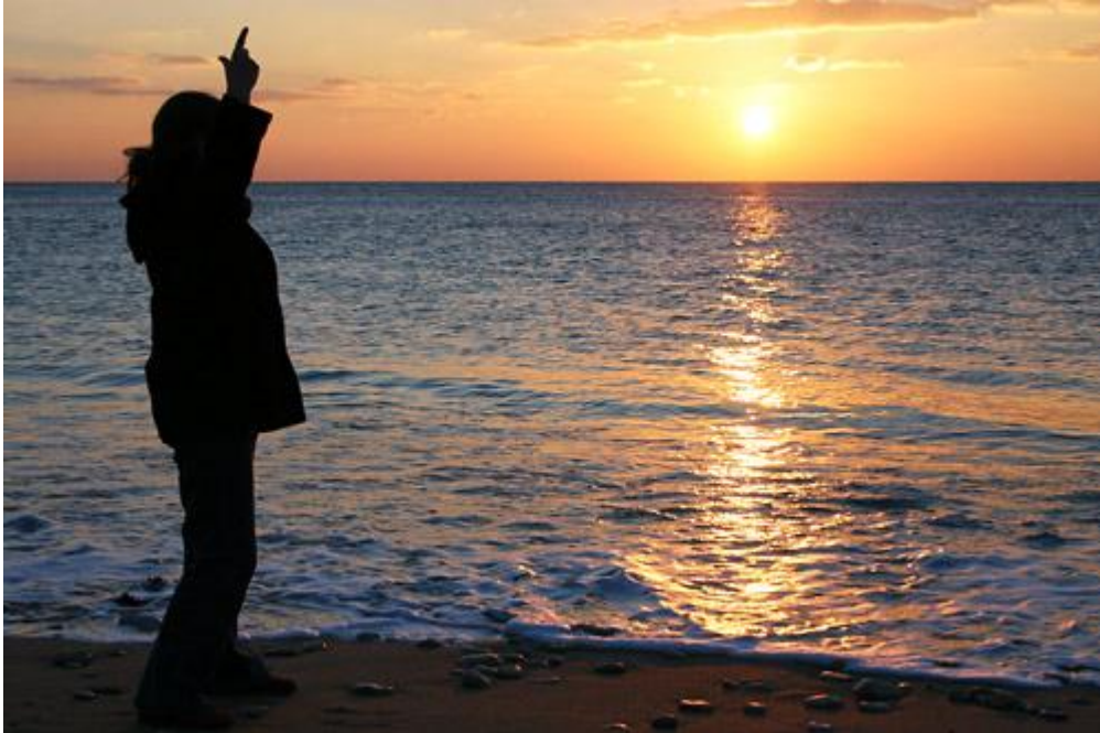
Coucher de soleil sur l'île de Ré

Le coucher de soleil est généralement l'une des activités préférées des photographes en herbe (et des autres...). Rien de tel qu'une belle lumière orangée sur la mer pour impressionner la famille et les amis au retour des vacances, et en plus, ce n'est pas très compliqué pour le coup. Voici quelques tuyaux.