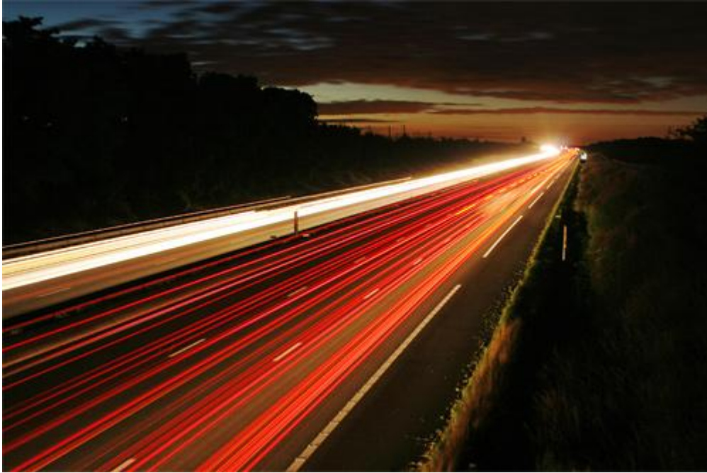
L'autoroute A1 entre Paris et Lille, photo Pascal Lando, Images en Somme