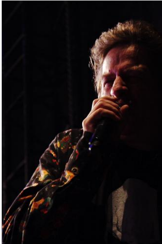
Hubert-Felix Thiefaine en concert

Réussir un joli portrait est généralement une tâche assez ardue. En effet, à la technique photographique pure et simple s'ajoute ici l'expression du modèle, qu'il faut savoir capturer au bon moment, sans forcer les choses (au risque de se retrouver avec un sourire conventionnel digne d'une séance photo lors de la dernière soirée crêpes de votre petite sœur...). Bref, mieux vaut ici bien maîtriser son appareil pour être efficace rapidement et ne pas rater l'instant... Ici plus que jamais, n'hésitez pas à « mitrailler » si vous avez un appareil numérique !