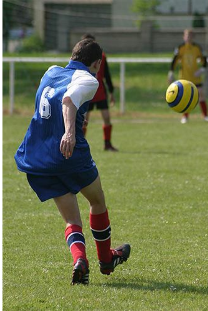
Un footballeur en action, image Pascal Lando

En photo de sport, l'idée est d'utiliser une vitesse assez importante, afin d'éviter d'obtenir d'effet de flou. Choisissez le mode « Sport » de votre appareil, ou optez pour le mode « Priorité à la vitesse » (ou « Tv », ou « P ») et choisissez une vitesse assez grande (du 200e à 4000e de seconde).