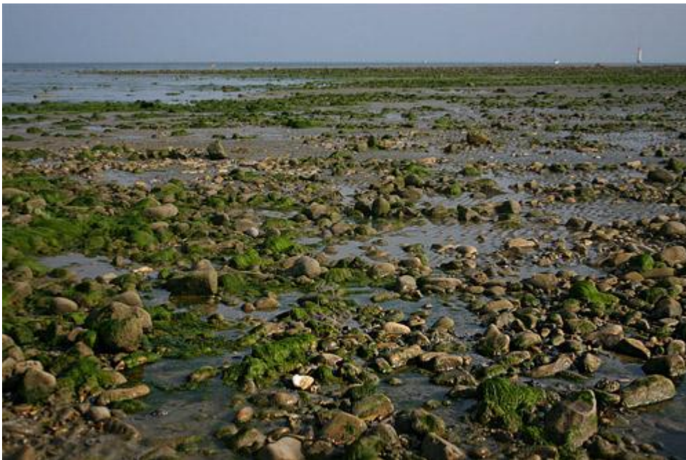
Fin de journée sur l'île de Ré, photo Pascal Lando, Images en Charente maritime

Au niveau des réglages, c'est généralement assez simple. Réglez le nombre ISO entre 100 et 400 selon les conditions de lumière, et shootez ! Vous pouvez éventuellement travailler avec le mode « Priorité à l'ouverture » (ou « Av » ou « A »), par exemple pour maximiser la profondeur de champ (voir le tutoriel sur la profondeur de champ). Vous pouvez également faire confiance au mode « Paysage » dont sont pourvus la quasi totalité des appareils actuels.